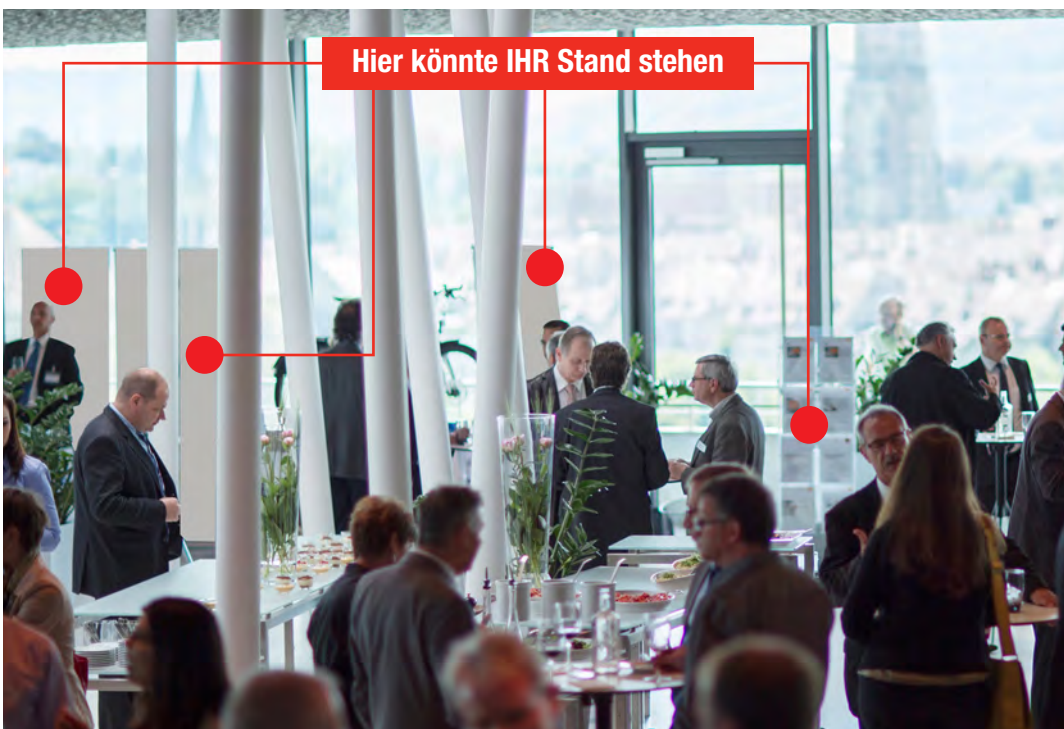
Foyer mit Ständen