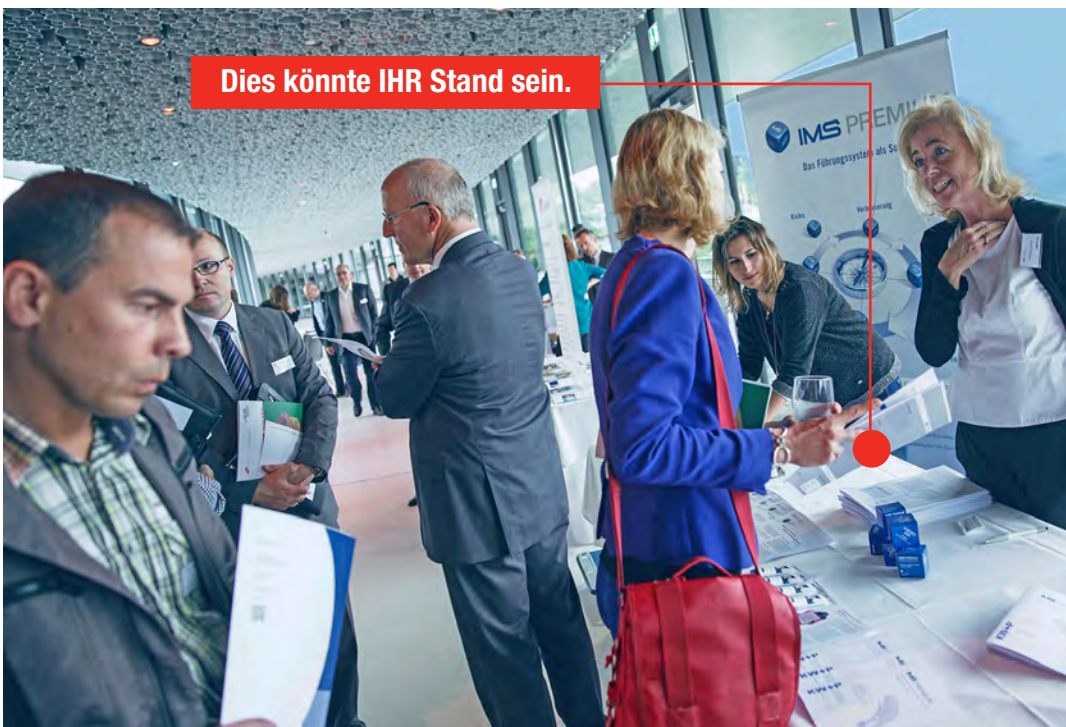
Stände im Foyer